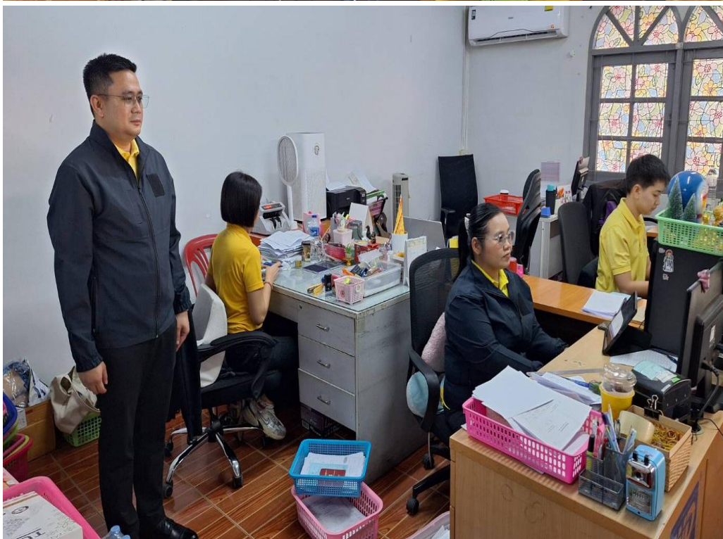
ผู้บังคับบัญชาติดตามการปฏิบัติงานอย่างใกล้ชิด ด้วยวิธีสุ่มตรวจการปฏิบัติงานของเจ้าหน้าที่